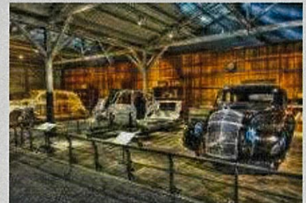
TOYOTA COMMEMORATIVE MUSEUM OF INDUSTRY AND TECHNOLOGY NAGOYA