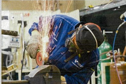
Construction Steel Work National Competition 2014 in Aichi