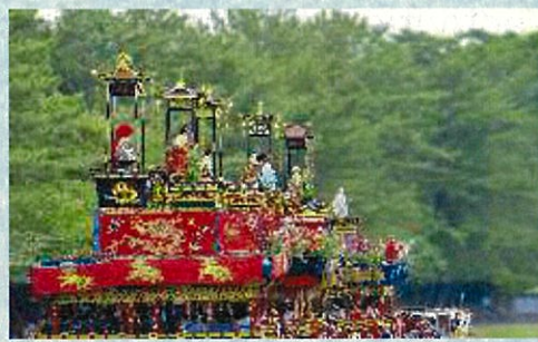
TENNOUMATSURI in TSUSHIMA AICHI