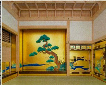
NAGOYA CASTLE Honmaru Palace