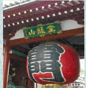
SENSOJI KAMINARIMON TOKYO