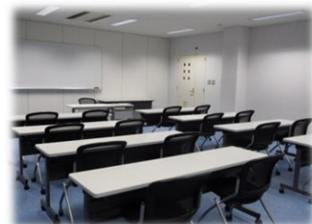
213 研修室2 (30名)