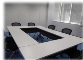
103 会議室1 (16名)

■岐阜県 新産業・エネルギー振興課 〒500-8570 岐阜市藪田南2-1-1 TEL:058-272-8835 FAX:058-278-2653