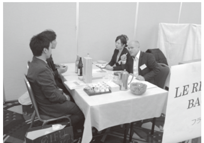
日本酒バイヤー招聘商談会 in 飛騨高山